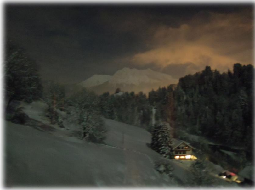
01.01.2015 Blick aus dem Fenster vom Herzghiesle

Genieße den Augenblick und die Stille. Empfange eine Botschaft für Dich für das Kommende...