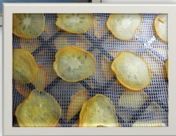
16.12.2015 Kaki getrocknet